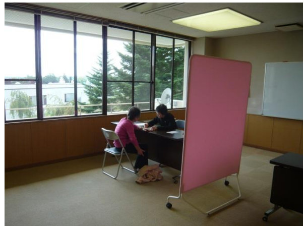
リハビリ健康相談